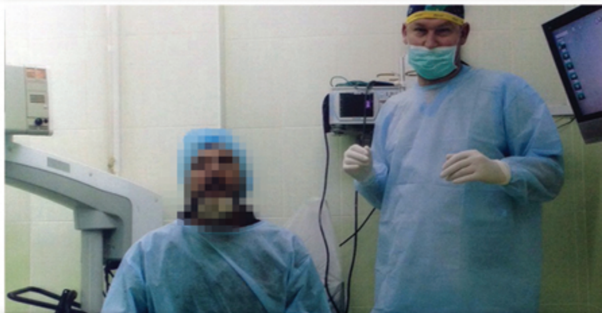
Оплата операции на глаза для солдата АТО