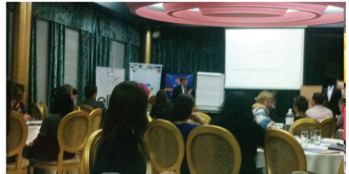
Бизнес-встреча организованная журналом «Simple»