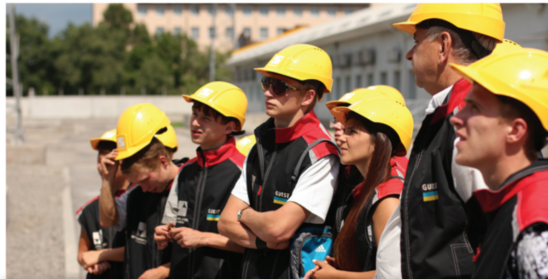
Экскурсия на завод «Интерпайп»