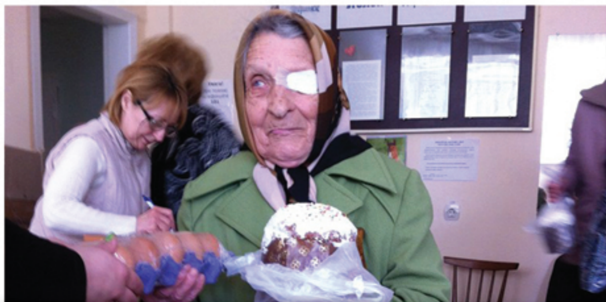
Продуктовые пайки для пенсионеров к Пасхе