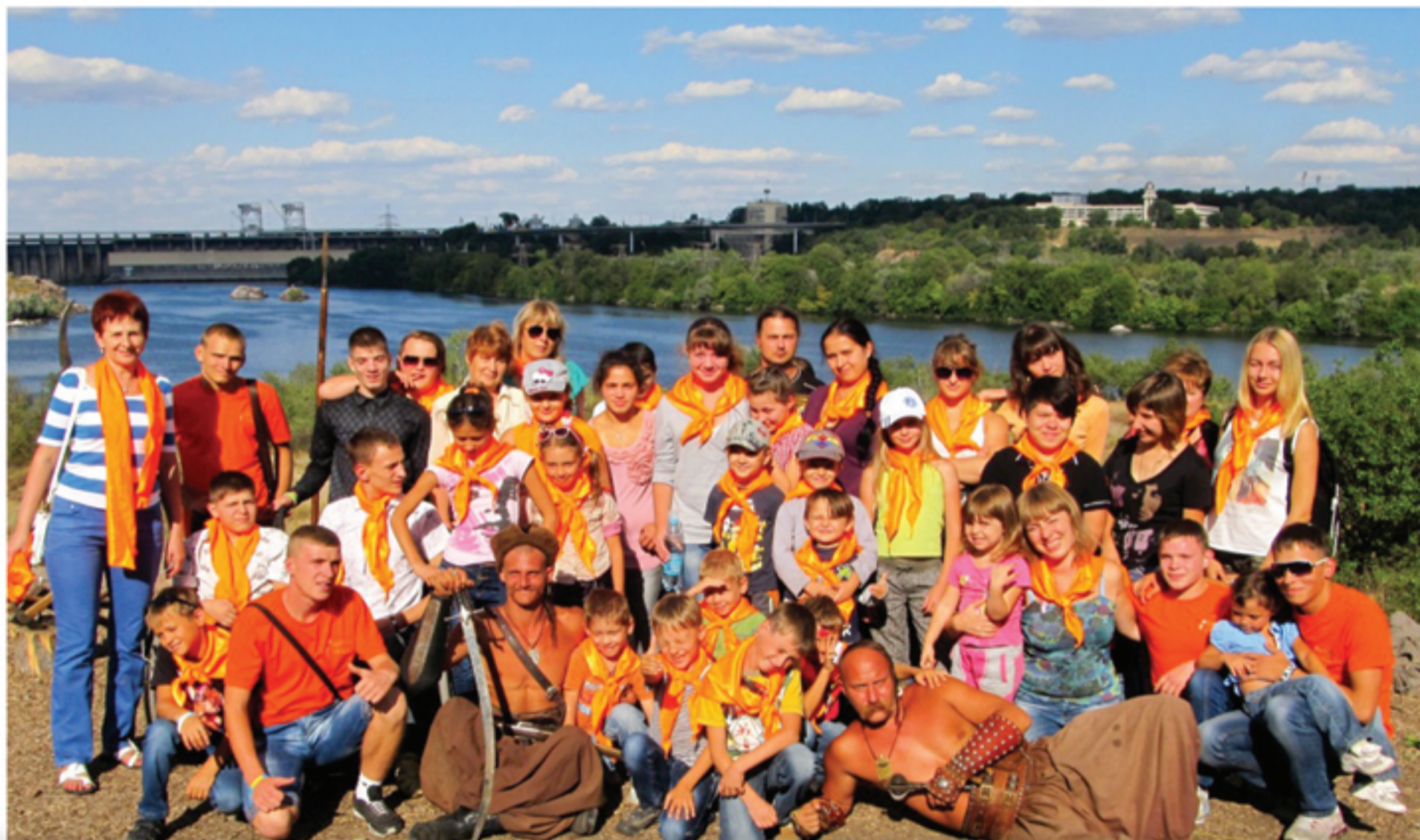
Расширяем кругозор. Экскурсия на о. Хортица