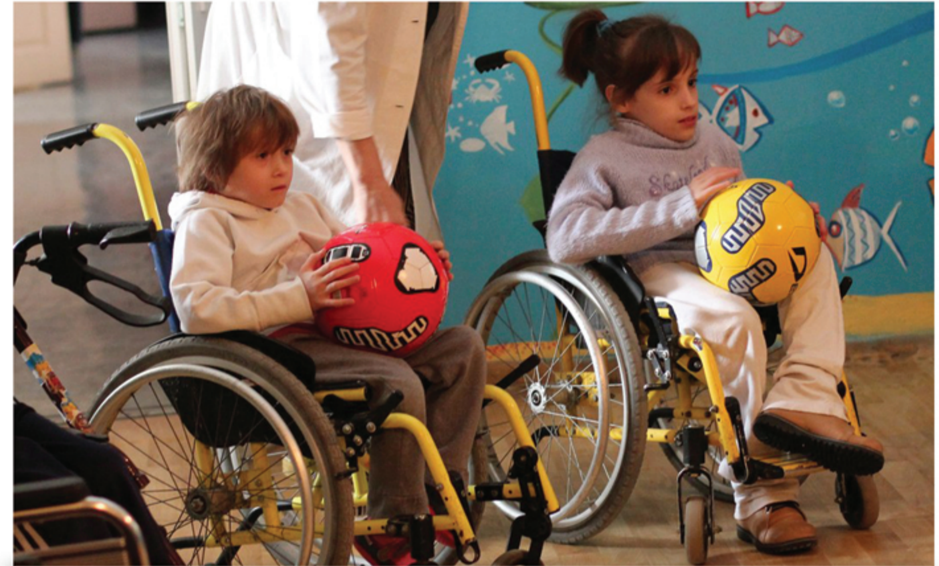
Проект «Здоровье майбутнє»