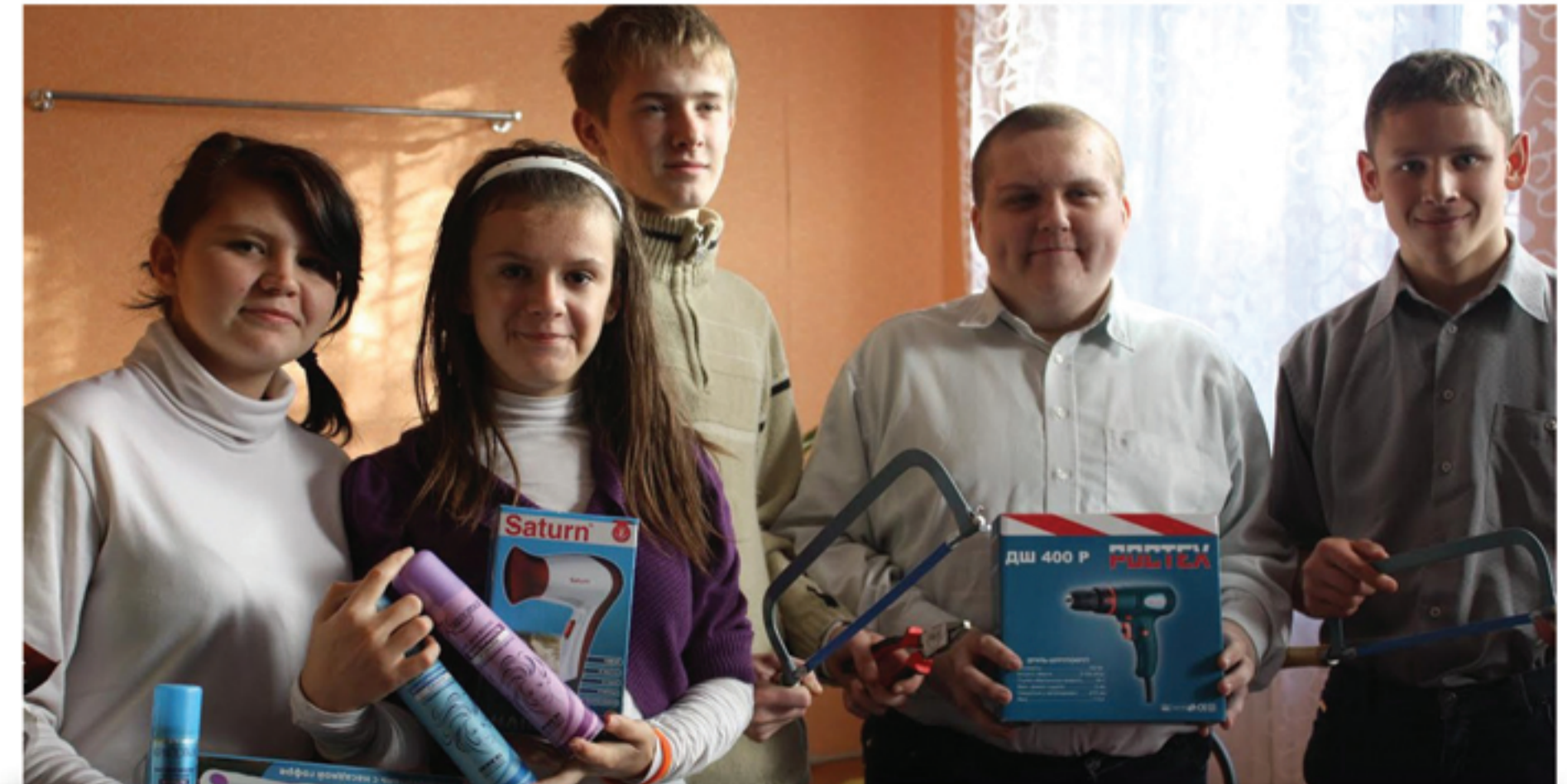
Закупка товаров для детских бизнес-проектов