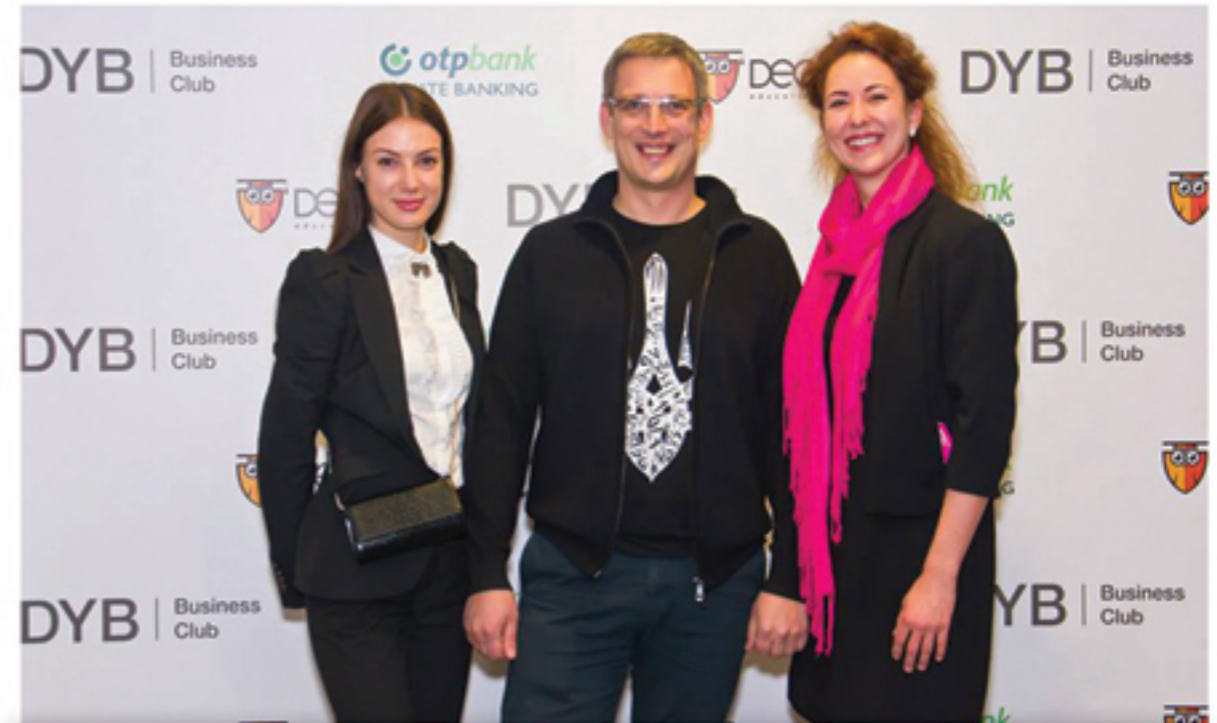
Бизнес-встреча DYB Ukraine