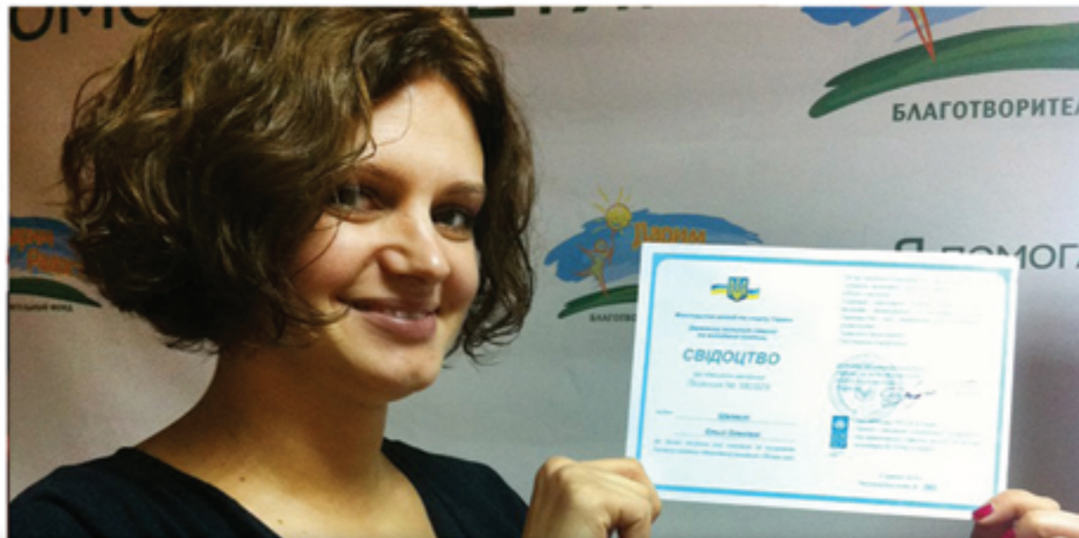
Тренинг «Молодіжний працівник» при підтримці ООН