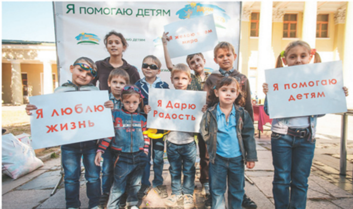
Благофест «Жить Здорово»