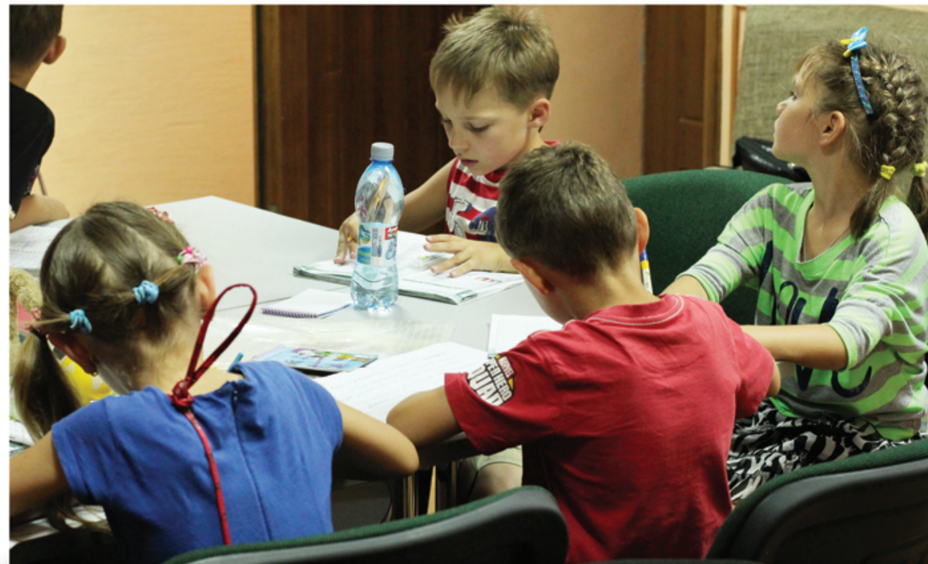
Еженедельные занятия в Центре