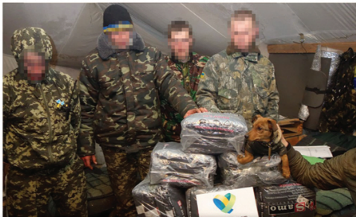
Покупка и передача спальных мешков в АТО