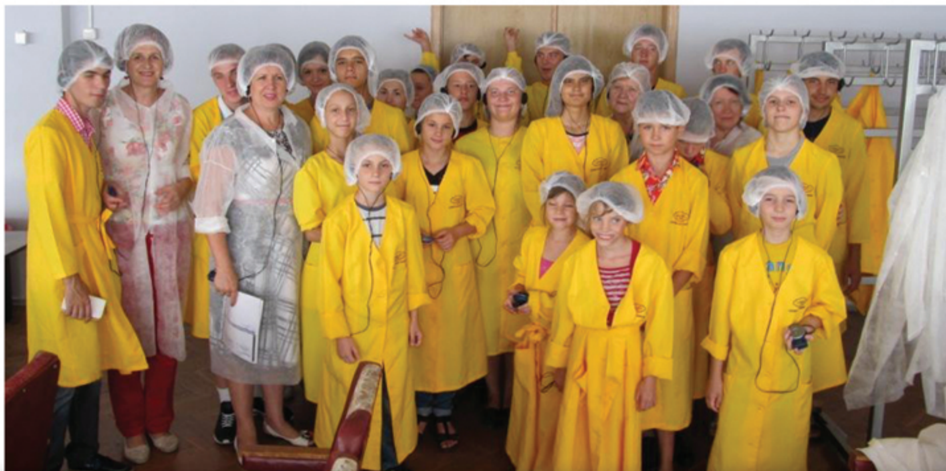
Профессиональная ориентация. Экскурсия на фабрику АВК