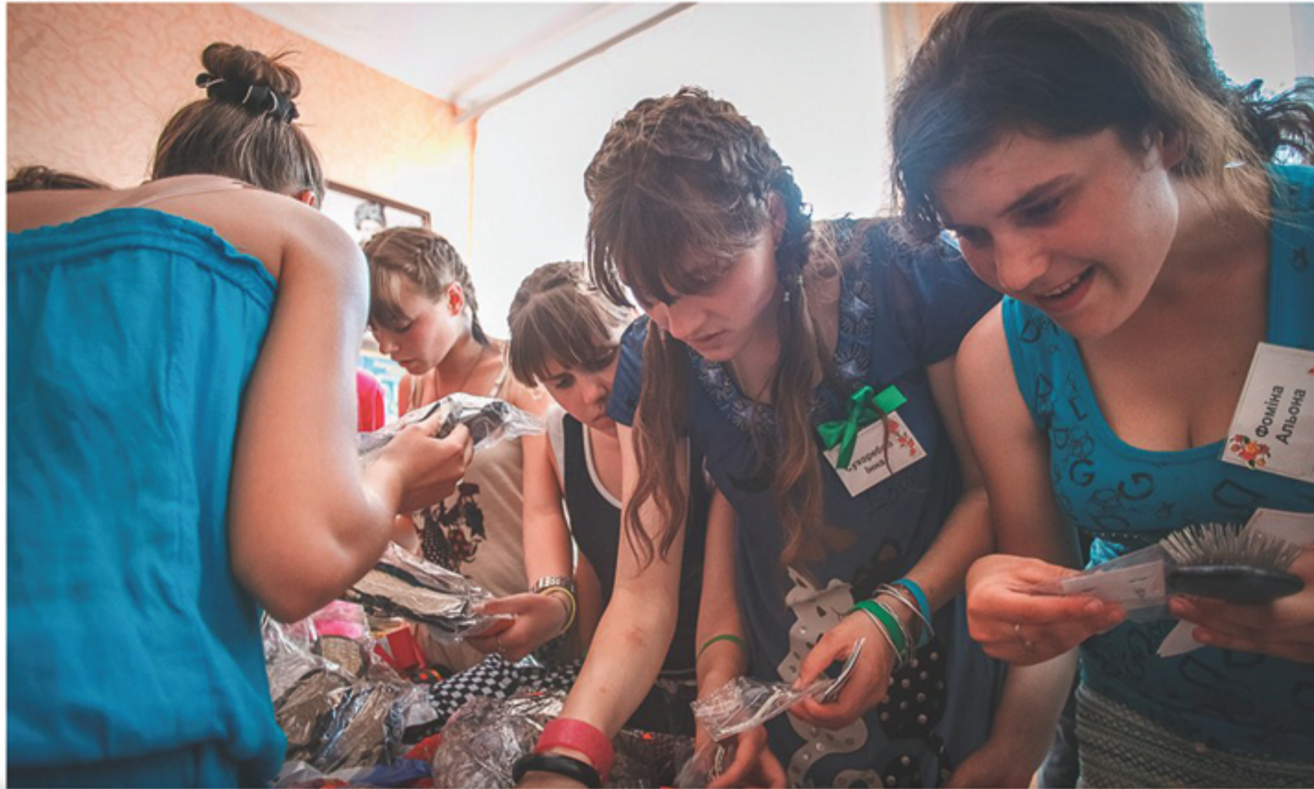
Экономическая ярмарка в УВК «Гармония»