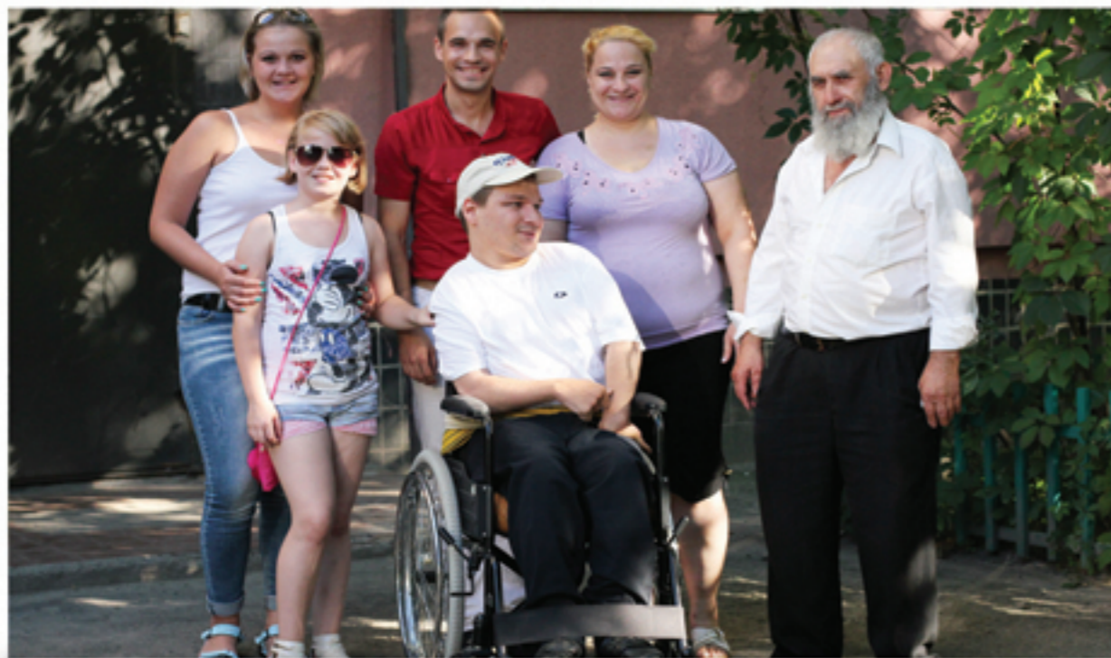
Покупка инвалидной коляски